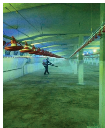
Sl.6 Dezinfekcija sa Dioxy Activ Supra FARM-om