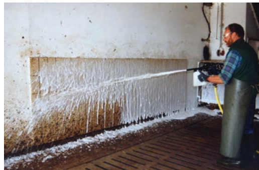
Sl.2 Pranje sa deterdžentom pomoću penomata