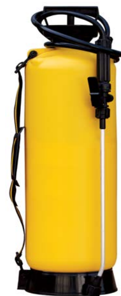
Sl.7 Klasična prskalice

Rastvor ravnomerno naneti na sve površine, posebno po prostirci.