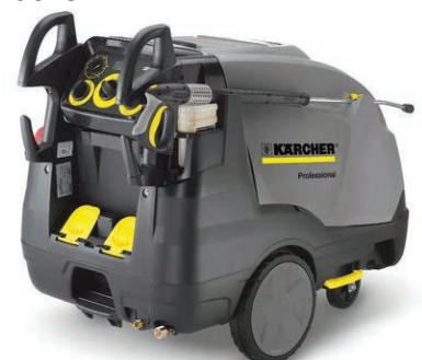
Sl.5 Aparata sa visokim pritiskom

Rastvor (oko 100ml/m 2 ) ravnomerno naneti na sve površine (strop, zidove, pod, opremu (hranilice, pojilice) itd.).